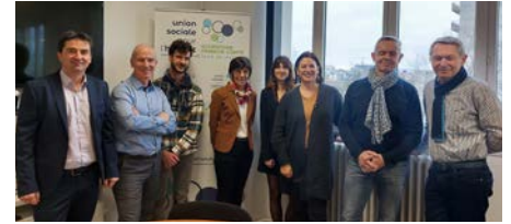
Membres du Comité de pilotage du partenariat USH de Bourgogne-Franche-Comté et EDF

De nombreux travailleurs sociaux de bailleurs, tels qu'Orvitis (Côte-d'Or), Nièvre Habitat, Reims Habitat ou encore Espace Habitat (Ardennes), ont été formés par les Correspondants solidarité d'EDF. Cette sensibilisation des acteurs sociaux et des agents de proximité (gardiens, techniciens) permet ensuite de mieux accompagner